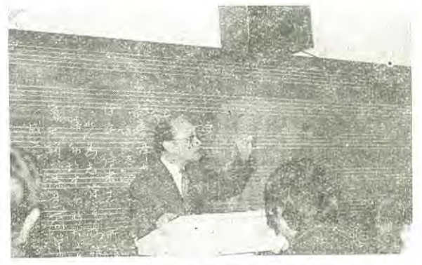
韋瀚章教授在香港音專講課時神態