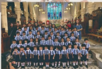
明愛荃灣童聲合唱團