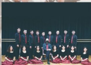
同調·雅頌合唱小組