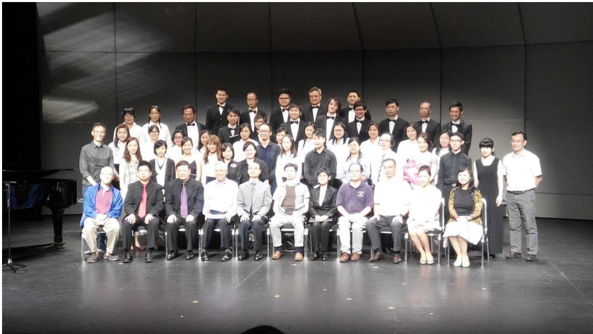
65週年音樂會大合照